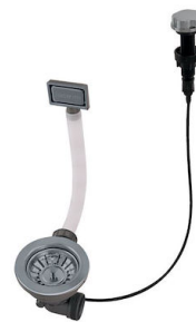
Desagüe automático Gun metal - PG 8407 110