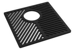
Rejilla Black 8100 651